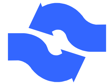
Sustentabilidade do sistema