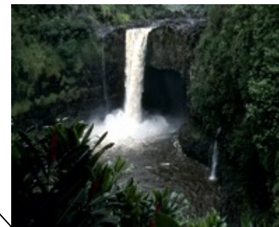
Preservação de mananciais