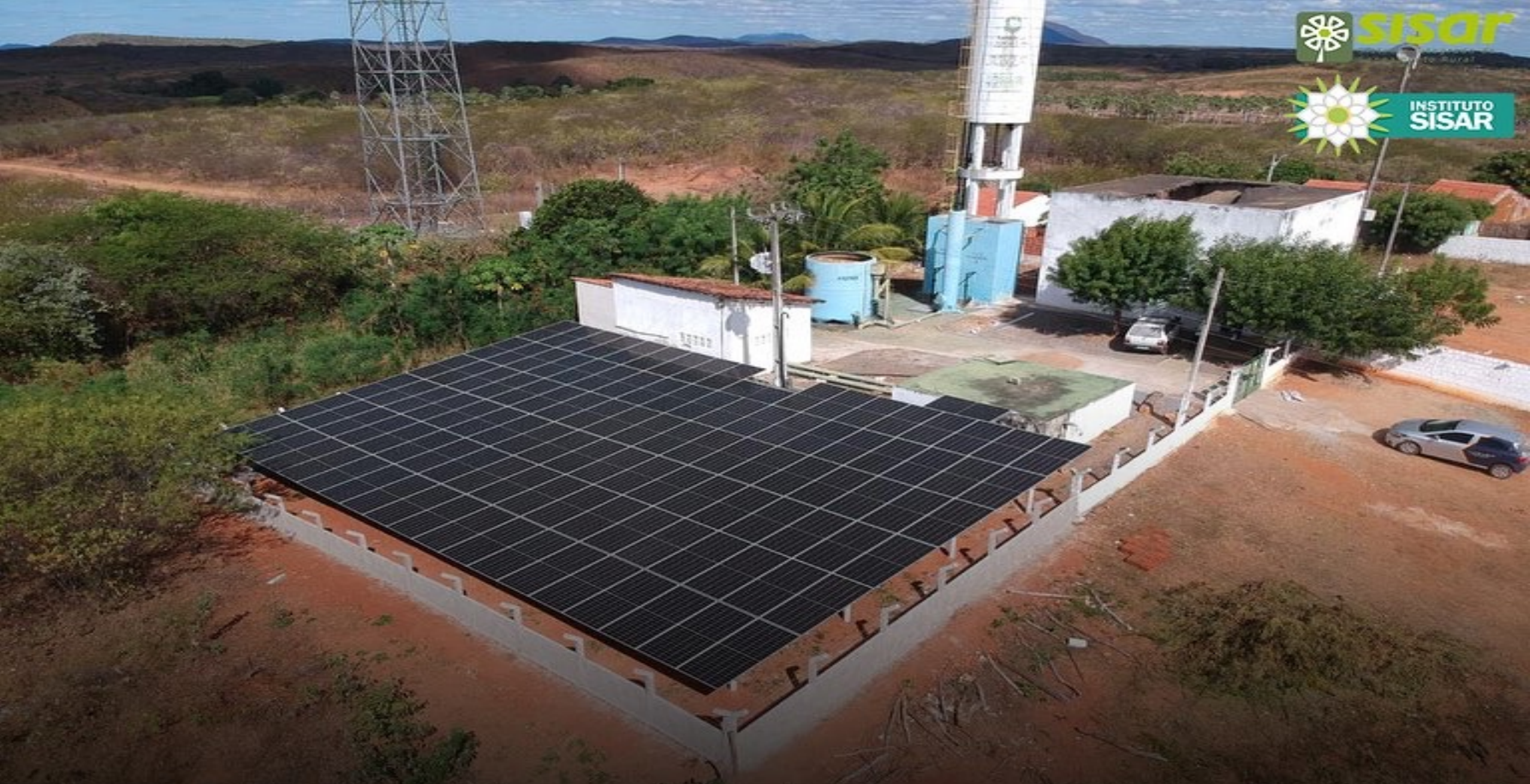
■ Placas Solares - Sisar Sobral (BAC - Bacia Acaraú e Coreaú)