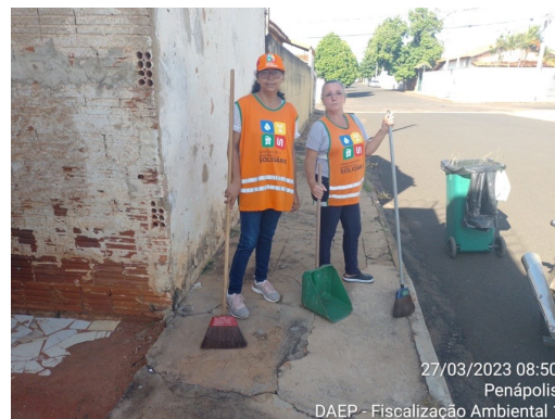
27/03/2023 08:50 Penápolis DAEP - Fiscalização Ambiental 1