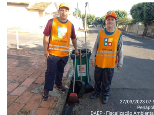
27/03/2023 07:58 Penápolis DAEP - Fiscalização Ambiental 1