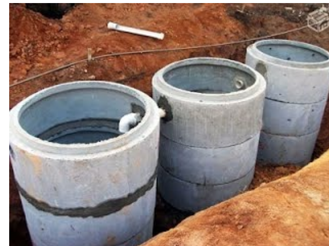
Tanque Séptico e Filtro Anaeróbio Concreto