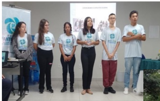
FÓRUM INFANTO JUVENIL

Objetivo: Fomentar nos alunos o desenvolvimento de suas potencialidades, visando à mudança de comportamento frente as questões ambientais, colaborando para a construção de uma sociedade crítica, participativa e um ambiente saudável.