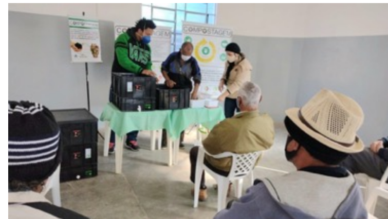
PROJETO COMPOSTAR É BEM ESTAR NÚCLEO DOS IDOSOS