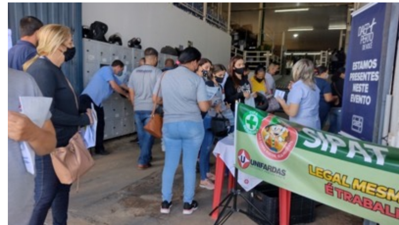
INDÚSTRIA DE TECIDOS - UNIFARDAS