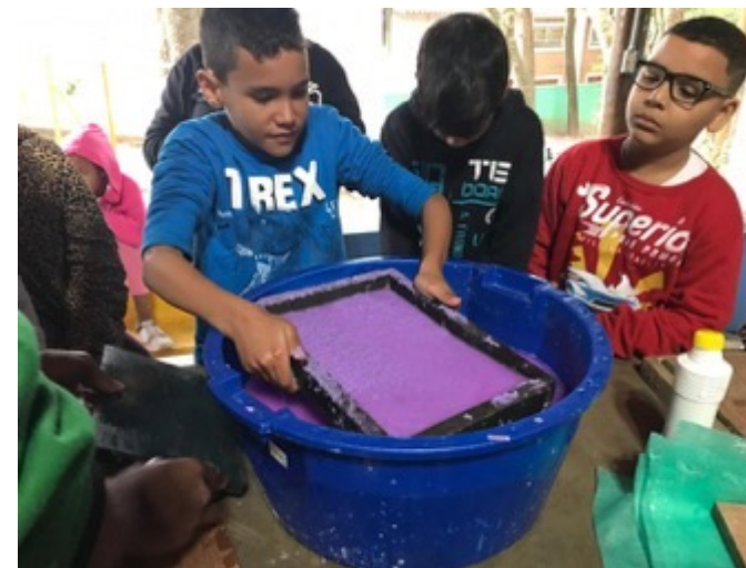
OFICINA DE CONFEÇÃO DE PAPEL ARTESANAL