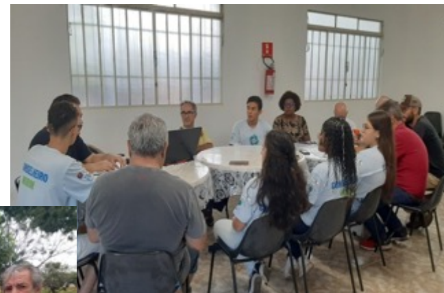
PARTICIPAÇÃO EM REUNIÃO DO CONSELHO DE MEIO AMBIENTE