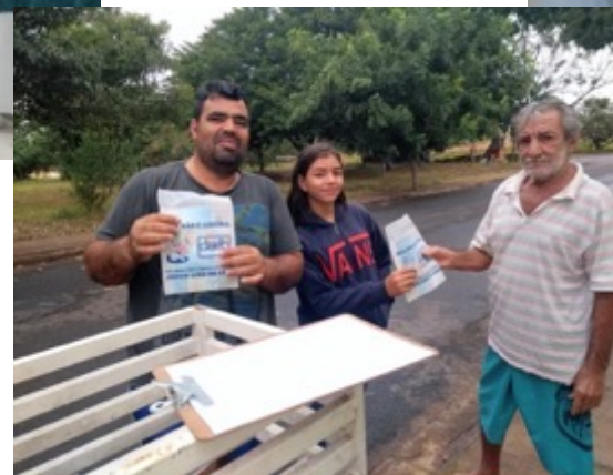
AÇÃO NA COMUNIDADE