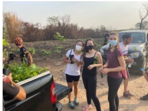
PEDAL COM PLANTIO DE ÁRVORES