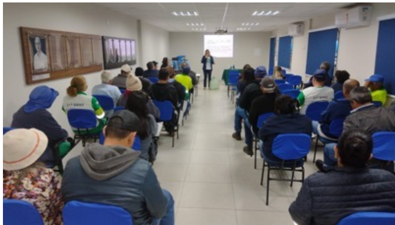
AUTARQUIA MUNICIPAL DAEP

Objetivo: Orientar os colaboradores das empresas quanto as práticas sustentáveis durante a rotina de trabalho.