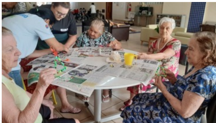
OFICINA COM MATERIAIS RECICLÁVEIS NO LAR VICENTINO

AÇÃO NA COMUNIDADE: EDUCAÇÃO AMBIENTAL PARA 3ª IDADE Objetivo: estimular a socialização a valorização humana e ambiental. Publico alvo: Idosos