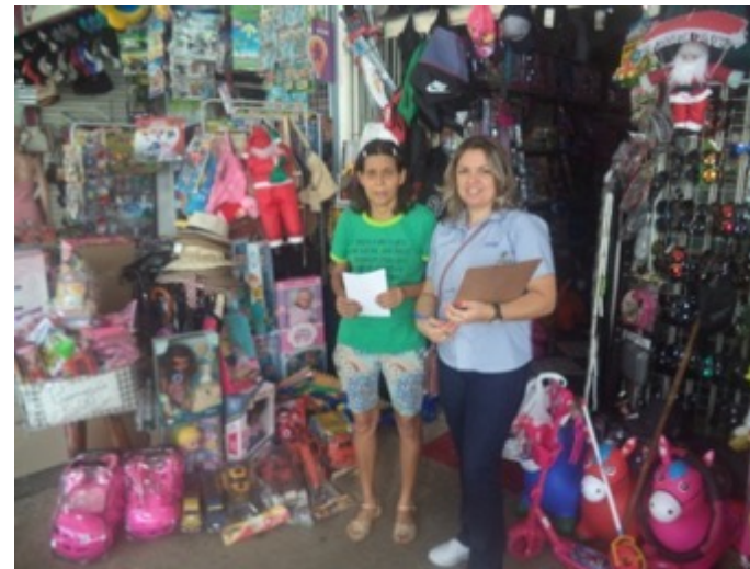
COMÉRCIO POPULAR (CAMELÓDROMO)