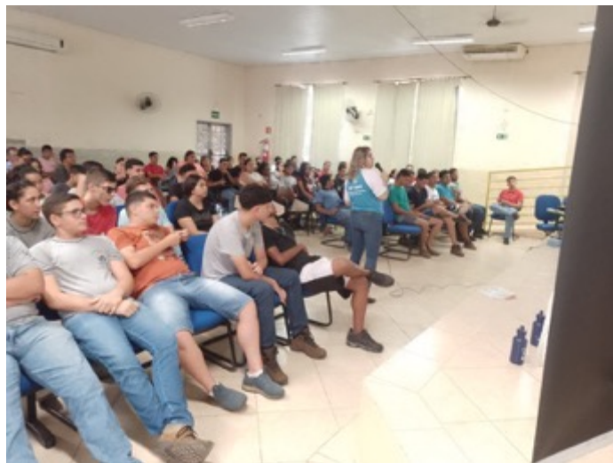
TEMA: SUSTENTABILIDADE COLÉGIO TÉCNICO AGRÍCOLA

Objetivo: realizar palestras e oficinas conforme tema solicitado pelas instituições