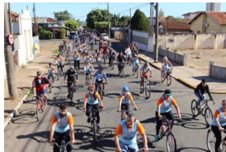
PASSEIO CICLÍSTICO POLUIÇÃO ZERO