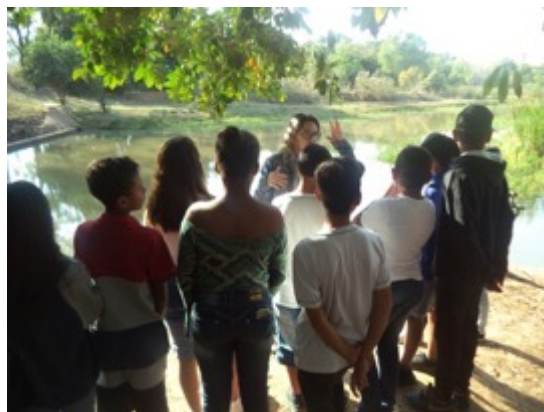
CAPTAÇÃO DE ÁGUA RIBEIRÃO LAJEADO

Objetivo: Conhecer os processos desde a captação da água, tratamento da água e do esgoto.