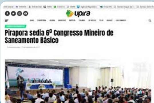
Cobertura do Congresso Mineiro em Pirapora