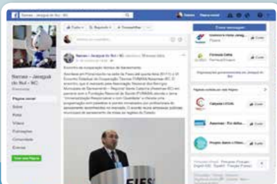
Cobertura do Encontro de Cooperação Técnica em Florianópolis