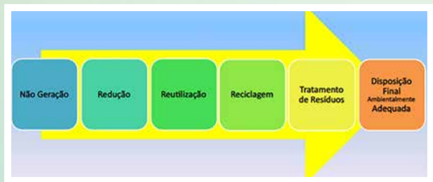
Figura 1 Hierarquia estratégica da gestão integrada de resíduos sólidos da PNRS

A hierarquia estratégica da gestão e do gerenciamento integrados de resíduos sólidos obedece, em praticamente todo o mundo, a uma ordem de prioridade, mostrada na Figura 1.