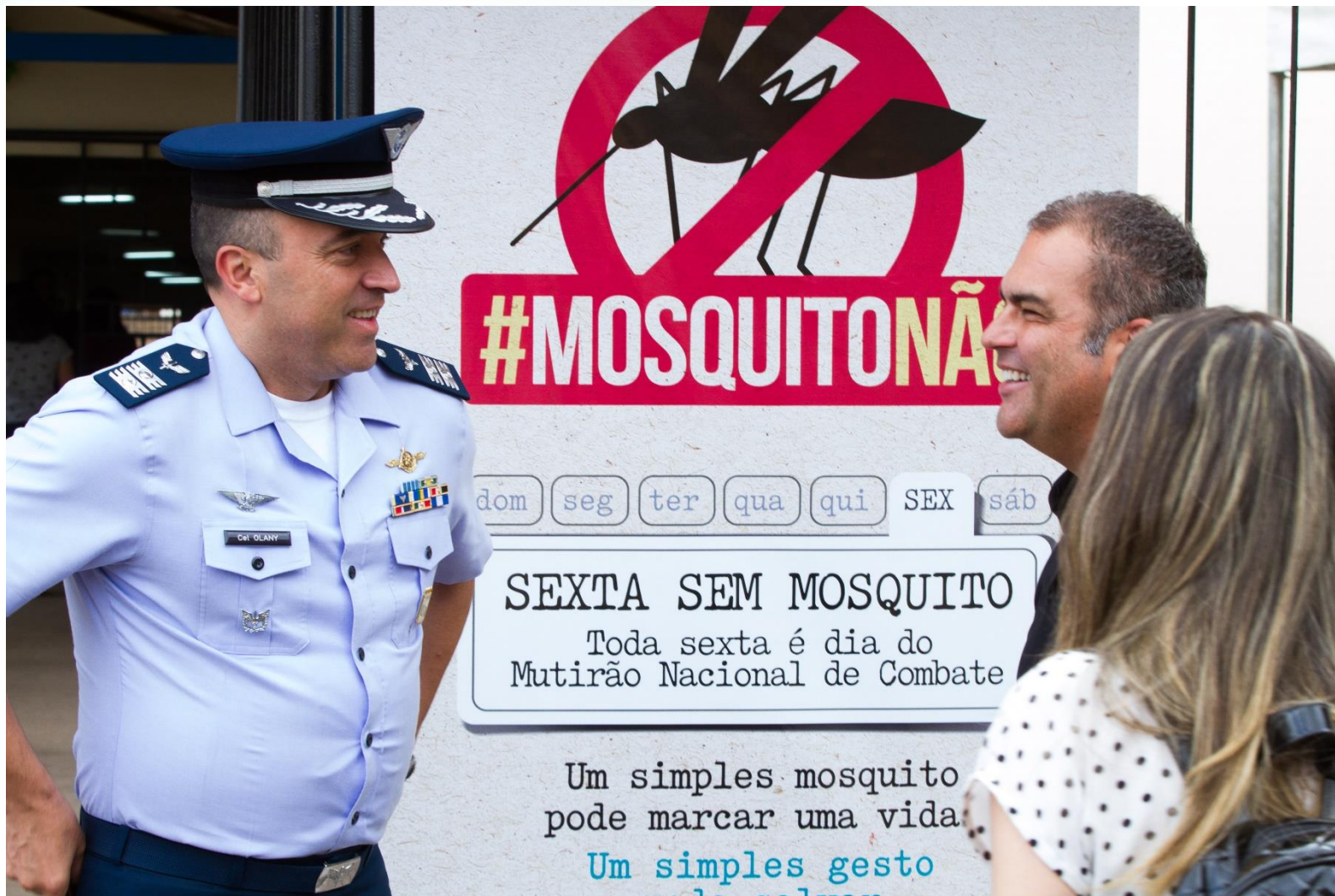
Fonte: MMA, 2016 – São Luís/MA – campanha nacional de combate ao Aedes