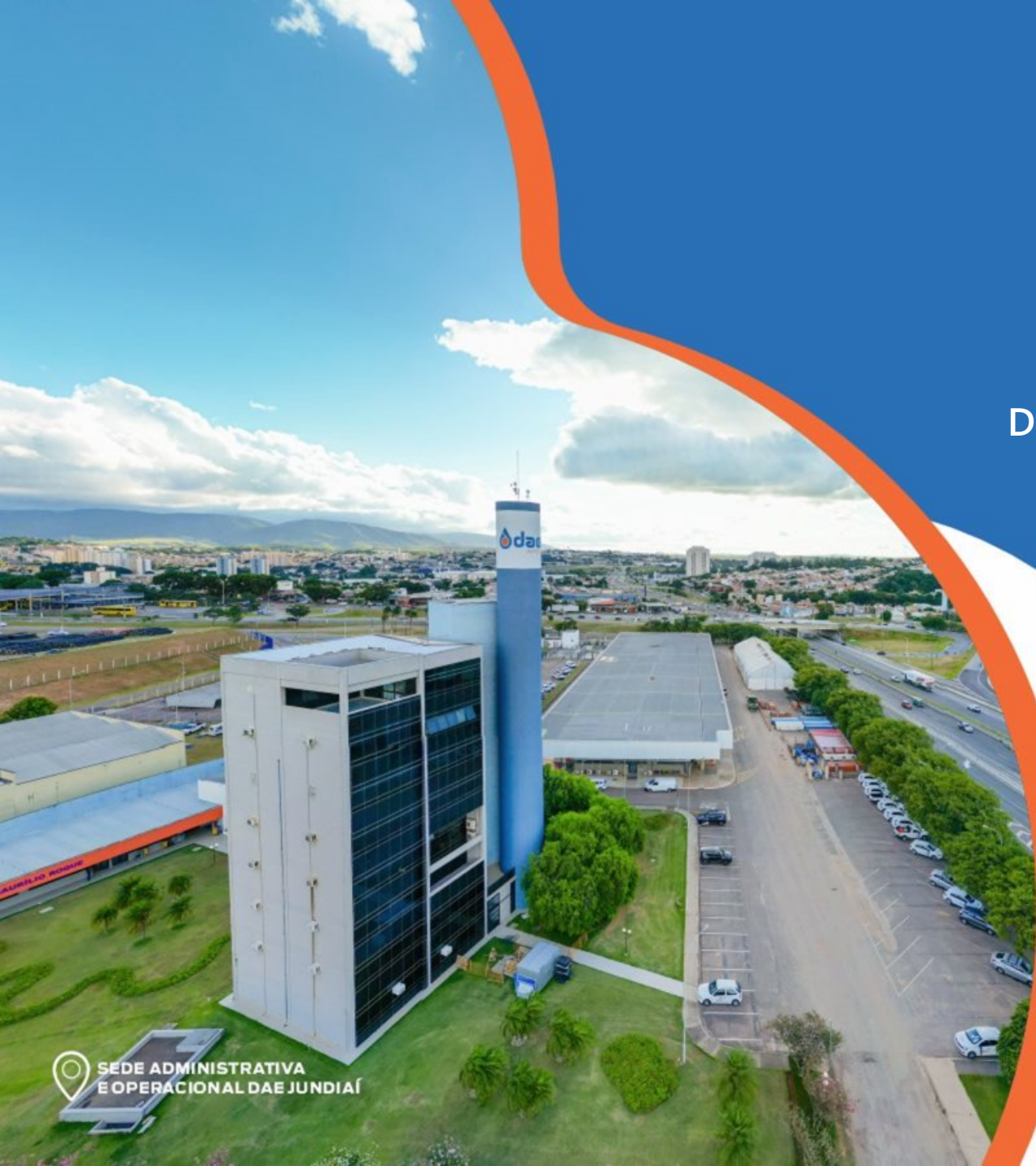
SEDE ADMINISTRATIVA E OPERACIONAL DAE JUNDIAÍ