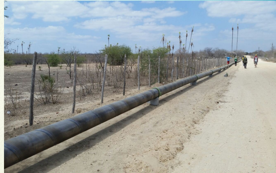
AMR DE IBICUITINGA