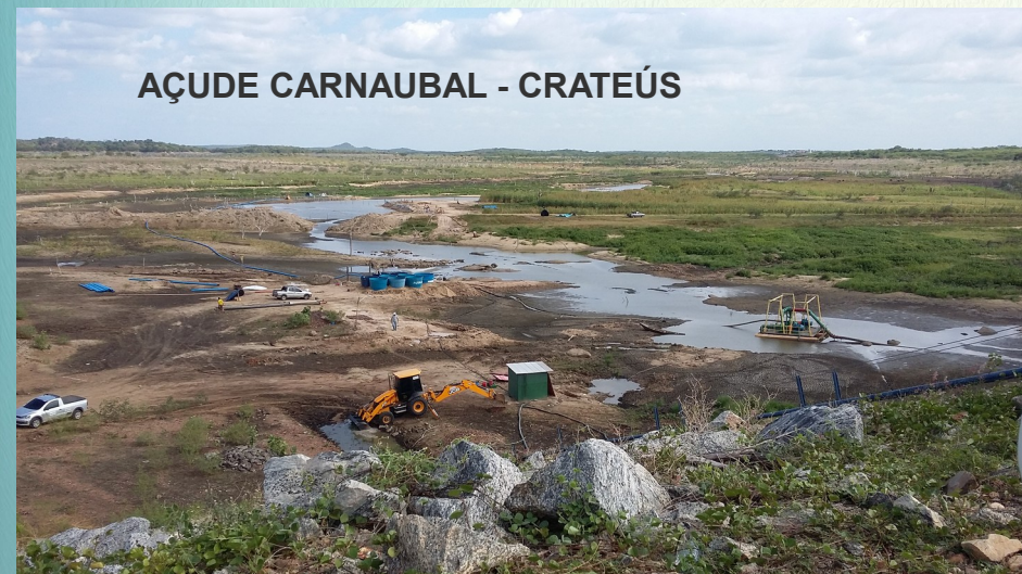
AÇUDE CARNAUBAL - CRATEÚS