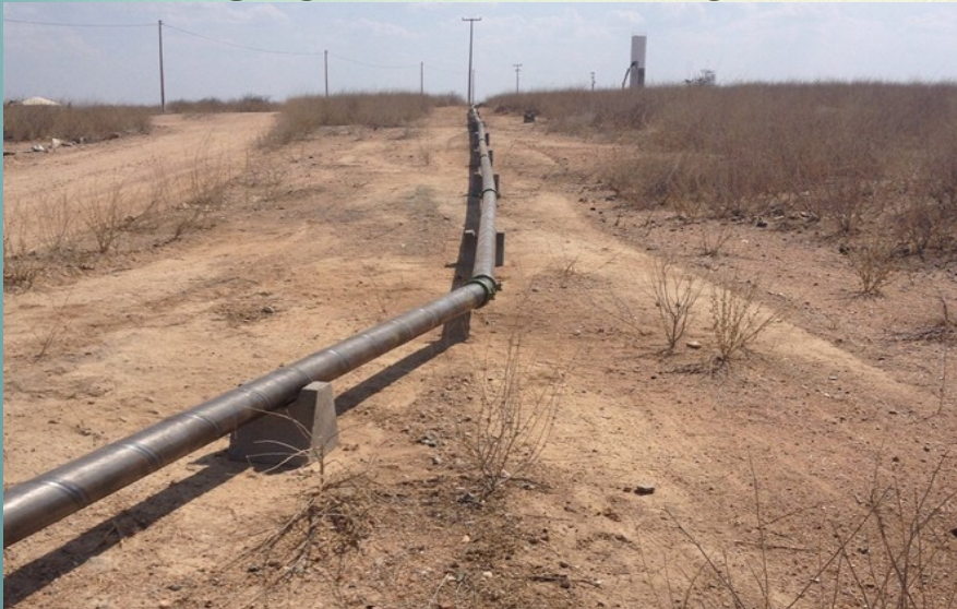
ADUTORA DE ARNEIROZ