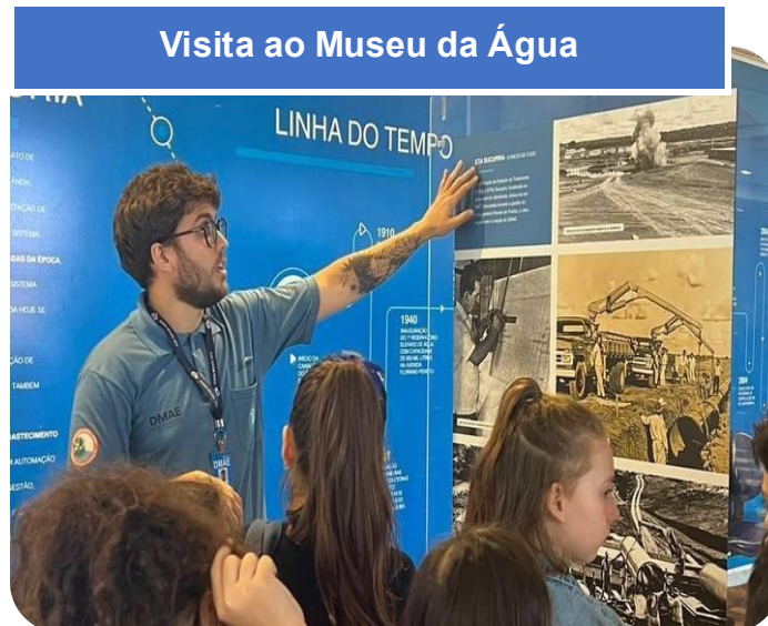
Visita ao Museu da Água