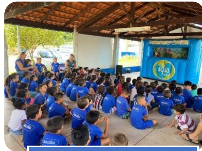
Teatro de Fantoques